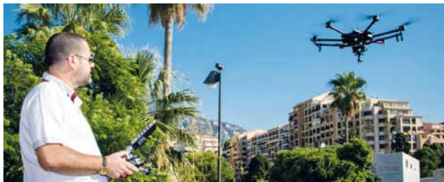
Le pilotage des drones nécessite des entraînements réguliers pour les équipes de l'Aviation Civile.