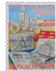
Dessin : Fabrice MONACI Impression : Offset Format du timbre : 30 x 40,85 mm vertical Tirage : 40.000 timbres-poste Feuille de 10 timbres-poste avec enluminures Valeur faciale : 0,95 €