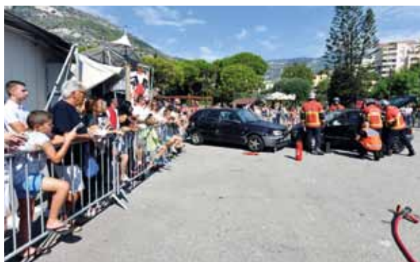
En collaboration avec le Gouvernement Princier, le Centre Hospitalier Princesse Grace (CHPG), l'Association Prévention Routière et plusieurs organismes privés, la Croix-Rouge Monégasque (CRM) a célébré la Journée Mondiale des Premiers Secours en organisant, le 8 septembre au Chapiteau de Fontvieille, une journée « portes ouvertes ». Initiations aux premiers secours, sensibilisation à la sécurité routière, visites d'une ambulance ou encore démonstration de désincarcération et de dégagement d'urgence d'un véhicule ont ainsi été proposées à des visiteurs de tous âges venus nombreux. Outre la CRM, le CHPG et la Prévention Routière, les animateurs de ces activités étaient le Corps des Sapeurs-Pompiers, la Compagnie des Carabiniers du Prince, la Direction de la Sûreté Publique et la Direction de l'Education Nationale, de la Jeunesse et des Sports.