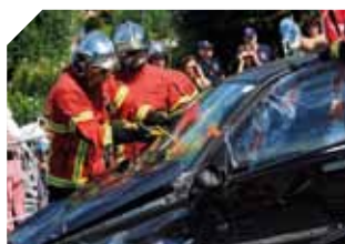
Les actions de sensibilisation à la sécurité civile