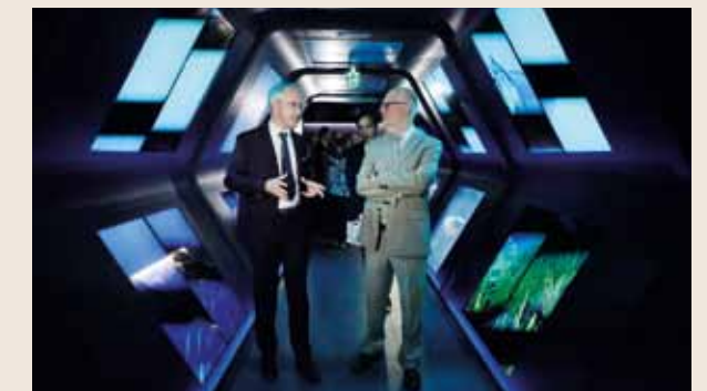
Le Ministre d'Etat lors de l'inauguration de l'espace « Monaco et l'Océan, de l'exploration à la protection », le 11 juillet dernier.

Par son approche ludique et stimulante, cette nouvelle salle a donc une vocation à la fois pédagogique et militante. Une forme d'invitation, pour les 650.000 visiteurs annuels du Musée Océanographique, à s'engager aux côtés de S.A.S. le Prince Souverain pour la préservation de l'environnement.