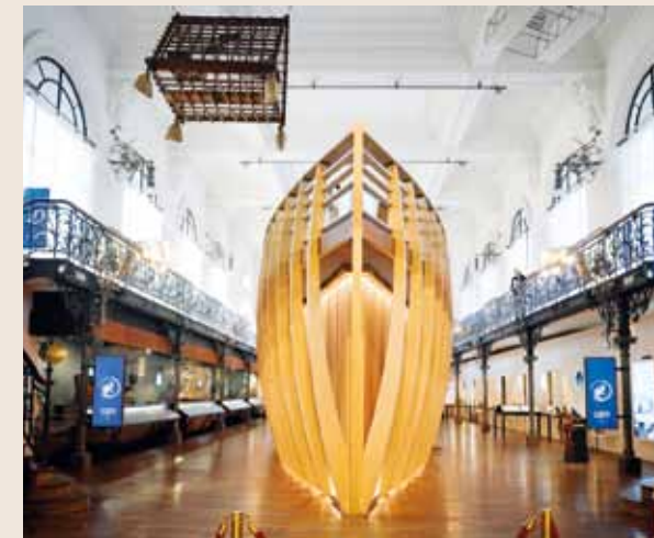
La proue du navire de 27 mètres de long qui accueille le public au cœur de cet espace immersif de 700 m².

Le nouvel espace du Musée Océanographique de Monaco (MOM) a été inauguré le 11 juillet par Serge TELLE, Ministre d'Etat, et des représentants de différentes institutions de la Principauté. Baptisé « Monaco et l'Océan, de l'exploration à la protection », il a pour vocation de retracer l'histoire de l'engagement des Princes de Monaco en faveur de la connaissance et de la protection du monde marin.