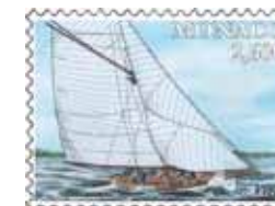
Dessin et gravure : Martin MÖRCK Impression : Taille-douce et offset Format du timbre : 40 x 31,77 mm horizontal Tirage : 45.000 timbres-poste Feuille de 10 timbres-poste avec enluminures Valeur faciale : 2,60 €