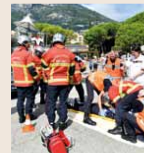
En partenariat avec le Gouvernement et les Services de l'Administration concernés, le CHPG, l'Association Prévention Routière et plusieurs organismes privés, la CRM a célébré la Journée Mondiale des Premiers Secours en organisant, le 8 septembre au Chapiteau de Fontvieille, une journée « portes ouvertes ». Initiations, sensibilisation et démonstrations de secourisme étaient au programme.