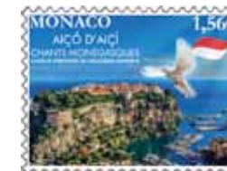
Conception graphique : Ludovic Tristan Impression : Offset et réalité augmentée Format du timbre : 40,85 x 30 mm horizontal Tirage : 40.000 timbres-poste Feuille de 10 timbres-poste avec enluminures Valeur faciale : 1,56 €