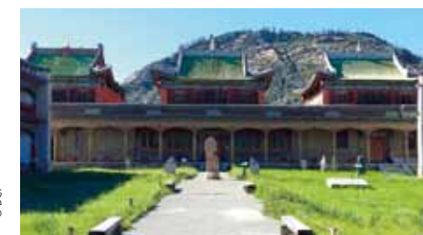
La coopération entre Monaco et la Mongolie a permis la conservation et la restauration d'un Monastère-Musée datant du XVII e siècle.