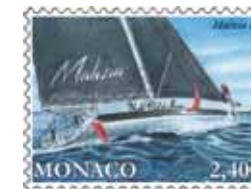
Dessin et gravure : Martin MÖRCK Impression : Taille-douce et offset Format du timbre : 40 x 31,77 mm horizontal Tirage : 45.000 timbres-poste Feuille de 10 timbres-poste avec enluminures Valeur faciale : 2,40 €