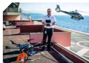
L'Aviation Civile à l'heure des drones