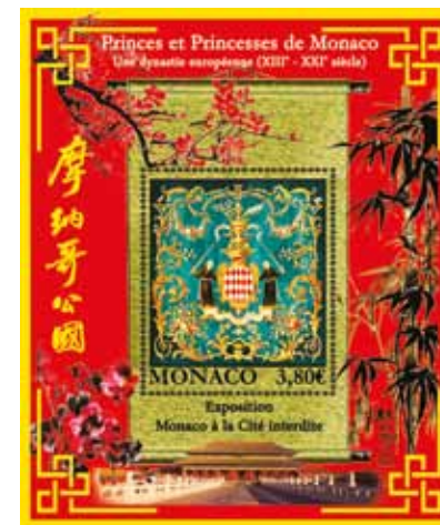
Dessin : Richard SEREN Impression : Hélogravure et dorure Format du bloc : 105 x 125 mm Format du timbre : 46 x 54 mm vertical Tirage : 35.000 blocs Valeur faciale : 3,80 €