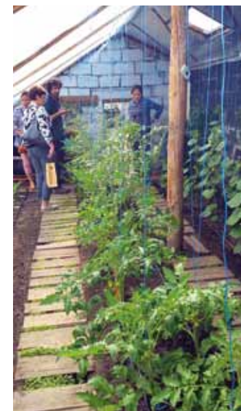
Visite d'une serre bioclimatique au concept innovant et adapté au climat extrême du programme « Santé et Nutrition » dans la province de l'Arkhangai.

En 2018, deux projets d'aide au développement sont encore soutenus par la DCI en Mongolie : l'appui aux éleveurs nomades et l'éducation préscolaire. A partir de 2019, la Principauté n'interviendra plus à ce titre dans la région afin de pouvoir concentrer son Aide Publique en faveur des Pays Les Moins Avancés.