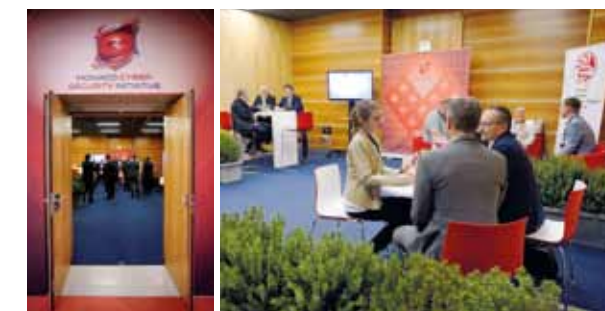
L'espace « Monaco Cybersecurity Initiative » des Assises de la Sécurité et des Systèmes d'Information : une belle visibilité pour les acteurs monégasques de la sécurité numérique.

(diffusion d'un communiqué de presse, réalisation d'un film de présentation, promotion sur les réseaux sociaux du Gouvernement Princier, etc.).