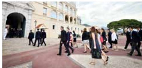
La découverte du Palais Princier a ponctué la visite du Groupe de travail en Principauté.

parer des conclusions sur l'état d'avancée de la négociation, qui devraient être adoptées par le Conseil de l'UE avant la fin de l'année 2018. Ce type de visite d'étude est donc essentiel pour que les arguments qui soutiennent les demandes formulées par Monaco dans le cadre de la négociation soient vérifiés afin d'être entendus.