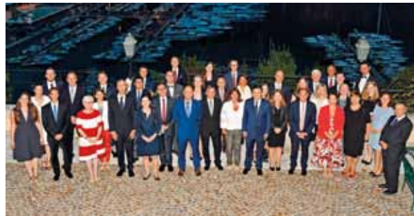
Le Groupe de travail a été reçu pour une réunion de travail et un dîner officiel à la Résidence du Ministre d'Etat.

Le Groupe de travail du Conseil de l'Union Européenne chargé du suivi de la négociation d'un accord d'association entre Monaco et l'UE (Groupe dit « AELE » : Association Européenne de Libre Echange) a effectué une visite d'étude à Monaco du 5 au 7 septembre. L'objectif de cette visite était de présenter et d'expliquer aux principaux interlocuteurs européens les réalités géographiques et démographiques de Monaco, ainsi que les spécificités institutionnelles, économiques et sociales de la Principauté.