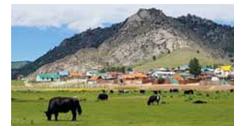
Des yaks dont la laine est utilisée par la coopérative « Ar Arvidjin Delgerekh », qui produit des vêtements et génère des emplois et revenus aux populations nomades et sédentaires.