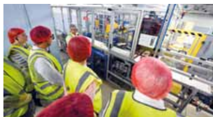
Les visites de plusieurs entreprises monégasques (comme ici l'usine de l'entreprise Coty Lancaster) ont permis à la délégation européenne de constater la diversité du tissu économique monégasque.