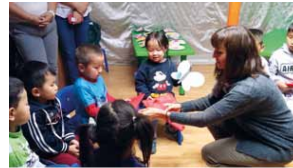
Rencontre avec des enfants nomades bénéficiant d'une éducation préscolaire dans une yourte en zone péri-urbaine.

Ce déplacement visait en outre à rencontrer les autorités nationales et locales afin de s'assurer de leur suivi sur ces projets qui