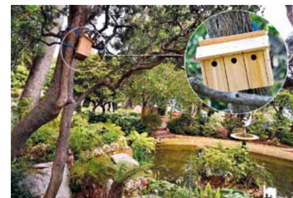
Vue d'un des nichours installés dans les Jardins Saint-Martin, sur le Rocher.

La DE a mandaté une étude scientifique auprès du Conservatoire d'Espaces Naturels de Provence-Alpes-Côte-d'Azur (CEN PACA) afin d'identifier les espèces concernées et de choisir des nichours adaptés aux oiseaux ciblés. Le choix des emplacements a été établi lors d'un repérage par les agents de la DE accompagnés d'un expert du CEN PACA. Deux zones sont actuellement équipées : les Jardins de Fontvieille et les Jardins Saint-Martin.