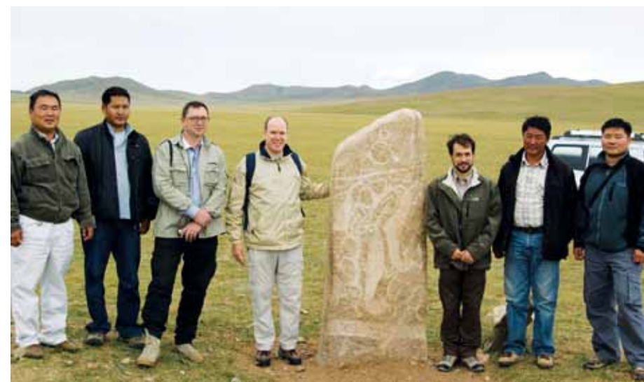
S.A.S. le Prince Souverain lors de Sa Visite Officielle en 2008, durant laquelle a été signée la Convention de Coopération Culturelle entre Monaco et la Mongolie.

lement dans les domaines de la santé, de l'éducation, de l'insertion socio-économique, de la sécurité alimentaire et de la coopération culturelle. Entre 2015 et 2017, 45.000 personnes ont directement bénéficié de cette aide qui leur a permis d'améliorer leurs conditions de vie. A noter que 140.000 personnes supplémentaires ont bénéficié de ces programmes de manière indirecte.