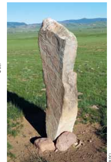
Une stèle mongole dont le recensement est effectué par les équipes du Musée d'Anthropologie Préhistorique de Monaco et de l'Institut d'Archéologie de l'Académie des sciences de Mongolie.