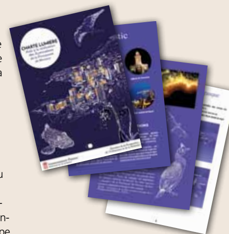
Aperçu d'une brochure pédagogique à destination des professionnels et des administrés éditée pour expliquer les enjeux de la Charte de Mise en Lumière des bâtiments de la Principauté. Cette dernière, consultable à la DPUM (23 avenue Albert II), présente les prescriptions générales relatives à la luminance, aux couleurs, aux faisceaux lumineux, aux consommations énergétiques maximales et aux horaires de mise en fonctionnement, ainsi que des prescriptions particulières liées aux typologies de bâtiments. S'inscrivant dans une démarche écoresponsable, elle constitue un document d'accompagnement à la conception, non réglementaire.

Par la suite, en s'appuyant toujours sur ce diagnostic, des prescriptions plus techniques ont été rédigées (puissances à installer, effets lumineux souhaités, type de lampe, couleurs, horaires de fonctionnement, etc.). « Cela constitue le corps de la Charte. »